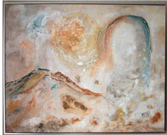
Apennijns droombeeld, 2009