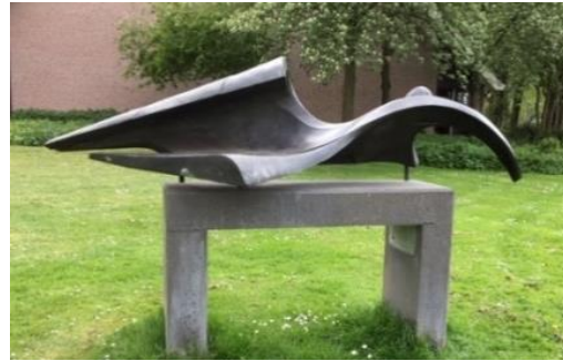
1986 De Golf

“De Golf” in opdracht van de winkeliersvereniging Molenvliet is een kunstwerk waar ik best trots op ben. Het werd onthuld op het plein bij het winkelcentrum Molenvliet, maar het staat nu heel mooi naast de Maranathakerk. Omdat Molenvliet staat voor water, vond ik het toepasselijk om een golf te creëren waarin een vrouwenfiguur zwemmend voor een deel in verdwijnt.”