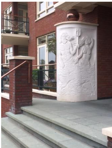
2007 Ingang Havenzathe

“Bij Sportlust '46 hangt nog een buitenplastiek, geen beeld, meer een schildering op specie die op de muur is aangebracht. Het zijn voetballers en het plastiek is enkele jaren geleden door leden van de Kunstkring hersteld. Ik moet nog eens kijken wat ze ervan gemaakt hebben”.