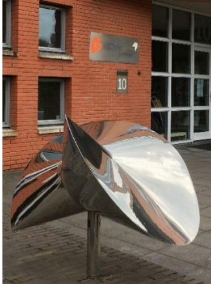
Bij de fa Gevaert, Stationsweg

De meeste beelden van Jan zijn al jaren in het straatbeeld opgenomen. Soms op een minder opvallende plek.