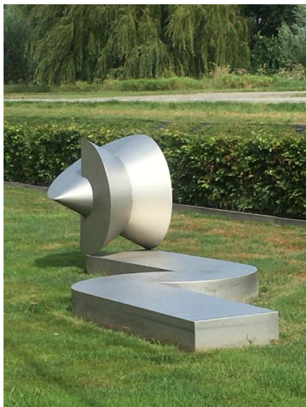
bij BluePrint Automation langs de Steinhagenseweg

“Bij BluePrint Automation (BPA) kan hij echt rollen over een eigen rolbaan. Die heb ik als een soort innovatie-werk samen met Bob Prakke van BPA ontwikkeld. Er staat er ook een bij het hoofdkantoor in Virginia. Ja, en in Amerika is die veel groter natuurlijk.”