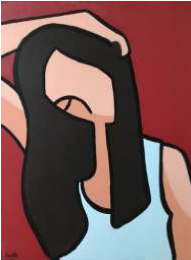
Vrouw met donker haar Acrylverf op doek, 60x80 cm €500