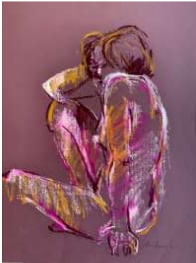
Model, zittend met elleboog op de knie