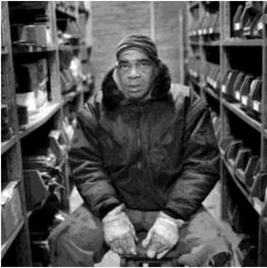
Working class hero #1 Fotografie, 60x60 cm €225