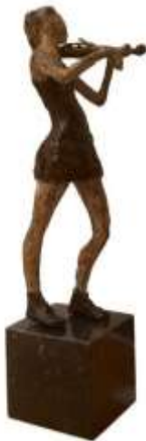
She's playing the violin Brons unica, 43x14 cm €1695