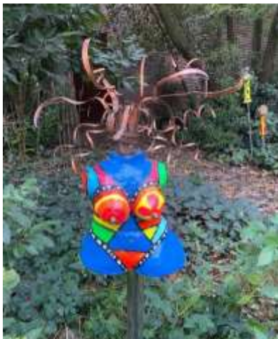
Spacegirl blue Keramik, koper, industrieel, hoogte 170cm €895