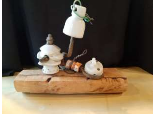
Zonder titel 3D assemblage, 30x30cm €175

Zo langzamerhand beschik ik over een (te) grote hoeveelheid "oud spul". Gekregen maar ook gevonden op straat, het bos, strand en rommelmarkten. Het is opgeslagen in kisten en dozen in mijn atelier en berging. Ook na 20 jaar verzamelen weet ik nog vrij goed hoe en waar ik aan al die voorwerpen ben gekomen. En nog steeds inspireren ze me om ze met elkaar te verbinden tot nieuwe vormen.