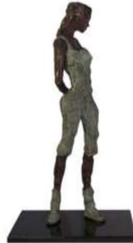
Beautiful girl 2/7 Brons, 30x25 cm €1295