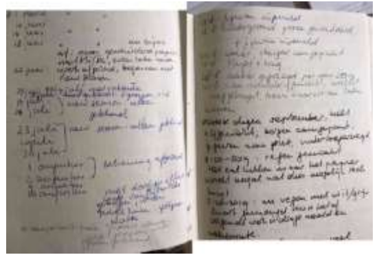
Aantekeningen in mijn werkboek

Dit werk ontstond naar aanleiding van de opvallende foto van de beklimming van de Mount Everest die in diverse kranten heeft gestaan. Je ziet een lang veelkleurig lint van bergbeklimmers die op hun beurt wachten om de top te kunnen beklimmen. Omdat de Himalaya in Indiaas, Chinees en Nepalees grondgebied ligt heb ik het alledaagse leven van de bewoners toegevoegd aan het Westerse tafereel.