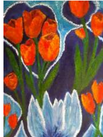
Tulpenfantasie Acrylverf op doek, 50x70 cm €500

Ik schilder meestal vanuit mijn gevoel. Wat me op dat moment inspireert of raakt. In deze lastige tijd wilde ik in elk geval iets schilderen waar ik een beetje blij van word. Bloemen in water heb ik geschilderd omdat ik sowieso iets met water heb en een bepaalde sfeer over wilde brengen. Tulpenfantasie is een schilderij waarin ik een warme verbinding wilde leggen met kleur en vorm.