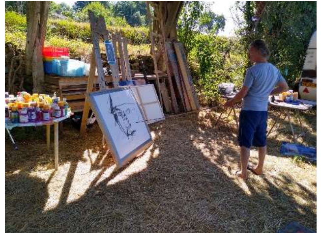
Aan het werk