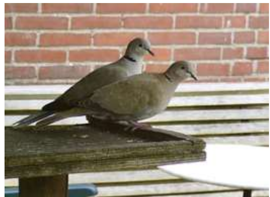
Tortelduiven in de tuin

Er komen vaak twee tortelduiven in onze tuin. Wij vinden ze prachtig en schattig als ze met elkaar zitten te kroelen. Als we de achterdeur open doen komen ze al op ons af. Ze kijken ons dan vragend aan: "Waar blijven de zaadjes of broodkruimels?" Soms eten ze uit onze hand.