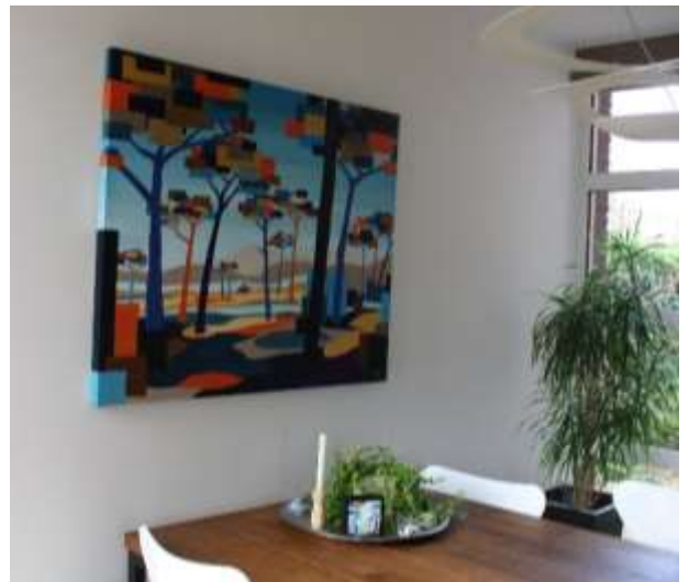
Aan de muur

Ik ben sinds een jaar bezig met een serie landschappen, geïnspireerd op Zuid-Frankrijk. Ik zoek een evenwicht tussen organische en geometrische vormen, die recht doen aan het beeld dat ik zelf heb van dat gebied. Met verschillende kleurencombinaties creëer ik sferen die de seizoenen representeren.