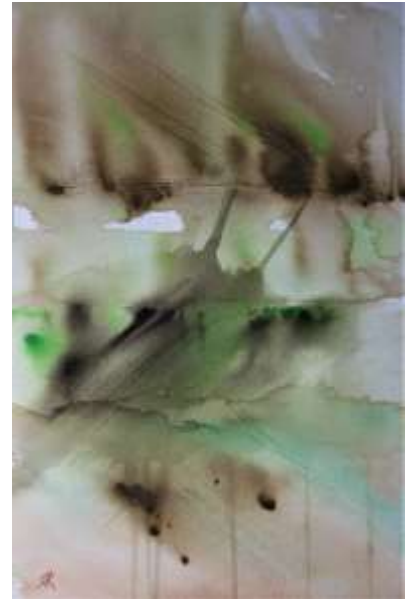
In de Flow