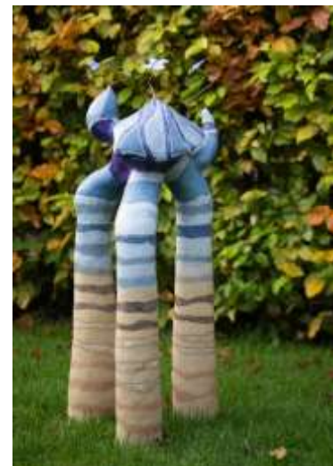
Beest op drie poten