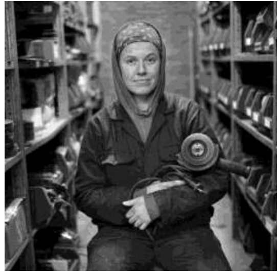
Working class hero #2 Fotografie, 60x60 cm €225

In het digitale geweld van deze tijd zou je ze bijna vergeten. De harde werkers; de pijlers onder onze economie. In de Rotterdamse haven, op een scheepswerf, kom je de stoere mannen en vrouwen tegen. Ik heb ze met de Hasselblad op 6x6 film vastgelegd. De Working Class Hero is van alle tijden.