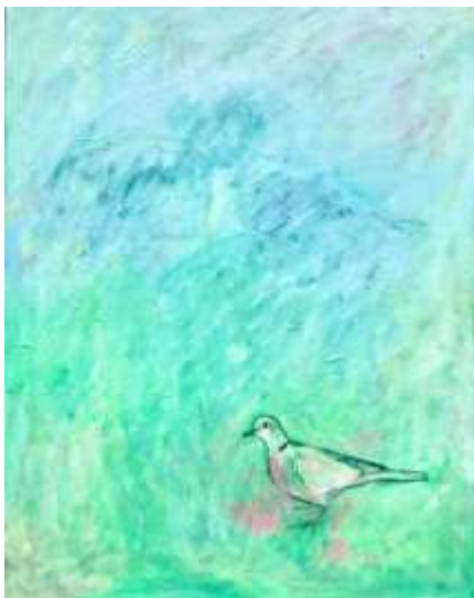
Duif Acrylverf, 70x90 cm €600