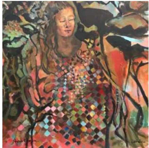
Apatheia Acryl, 50x50 cm €850,00

Ik schilder vanuit mijn gevoel en probeer de gedachten die in mijn hoofd spelen te vertalen naar beelden. Iedereen kan vervolgens zelf bepalen wat hij of zij voelt en ziet bij "Lethargie" of "Apatheia".