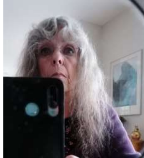
Aan het werk

Door corona heeft de portretschildergroep van de dinsdagochtend besloten voorlopig niet in het atelier te werken. Om toch te schilderen naar model maken we nu een zelfportret. Hiervoor kun je een foto gebruiken, een of twee spiegels. Ik heb hier een spiegel gebruikt. Dan schilder je je spiegelbeeld en niet het beeld wat je omgeving van je ziet. Dat is dan ook meteen de moeilijkheid, want herkent men je wel of niet?