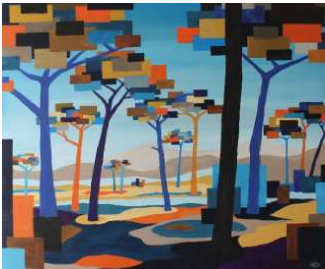
Le paysage d'automne Acryl, 120 x 100 cm €400