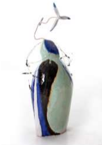
Pinguïn met molentjes