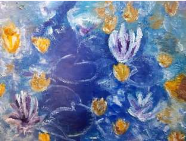
Bloemen in het water Acrylverf op doek, 70x50 cm €400