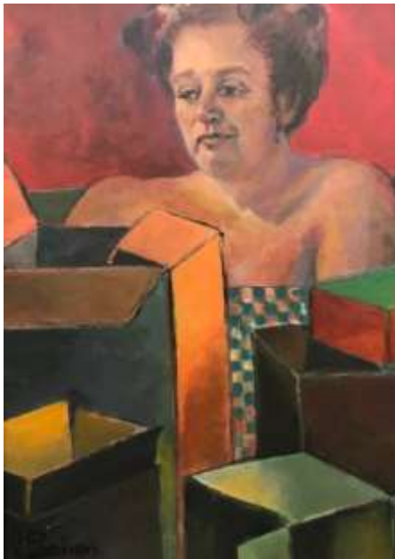
Lethargie Acryl, 30x50 cm Niet te koop