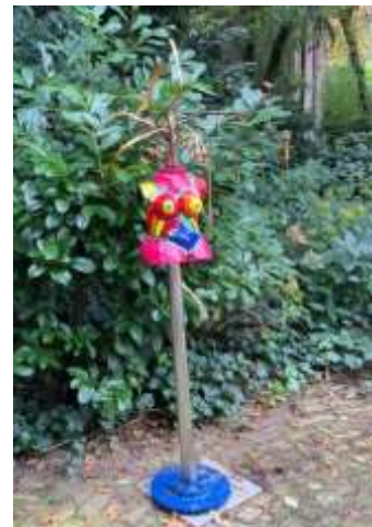
Spacegirl pink Keramik, koper, industrieel, hoogte 170cm €895

Mijn kunst ontstaat door inspiratie en om dit tot expressie te brengen gebruik ik klei. In mijn eigen atelier creëer ik vrouwelijke schoonheden in extreme vormen die daarna in de oven gebakken worden en in felle kleuren worden geschilderd in combinatie met industriële materialen. Dit geeft een unieke uitstraling aan de sculpturen. Deze beelden zijn geschikt voor binnen en buiten en ik exposeer ze in mijn eigen beeldentuin.